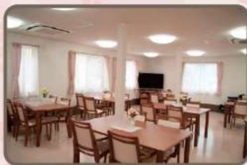
開放的な食堂で楽しくお食事。